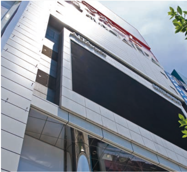
新宿ダイビル (スタジオアルタ)